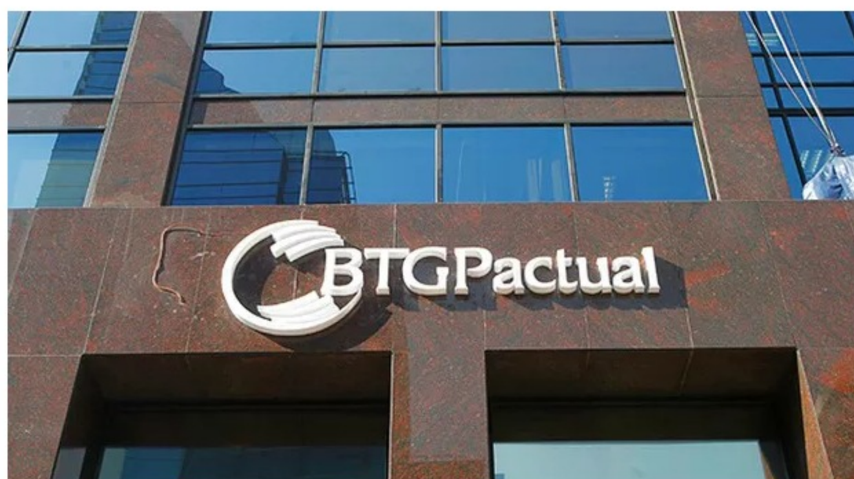
BTG Pactual

O banco BTG Pactual comprou 20% da startup CredPago , que atua no mercado imobiliário como uma espécie fiadora para os inquilinos em contratos de locação . O valor da negociação não foi divulgado.