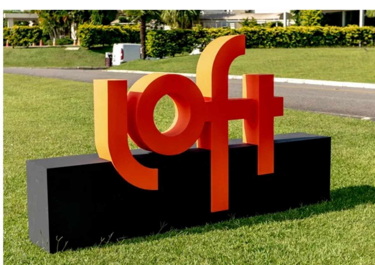
Pelo acordo, a Loft terá 100% da operação da CredPago, mas a gestão da empresa seguirá a cargo de seus atuais diretores